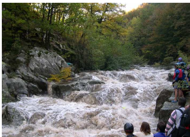
Escalier de la Peyre