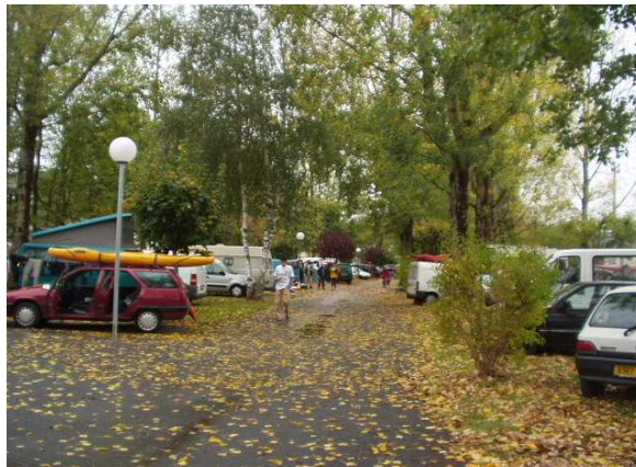
Brassac camping municipal