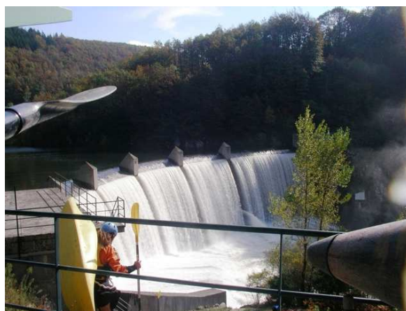
Barrage de Pontviel (départ)