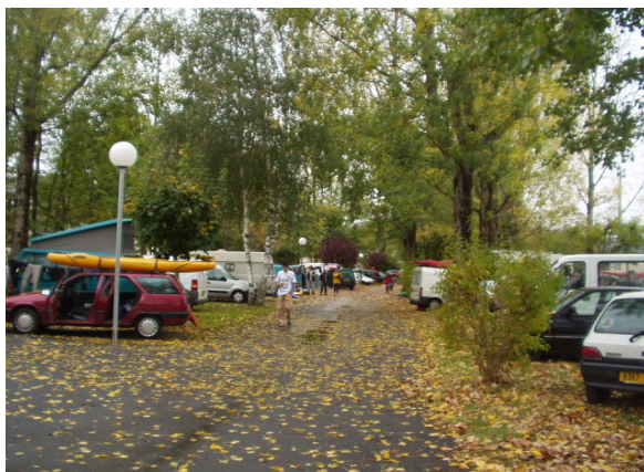
Brassac camping municipal

Gîtes du Camboussel 4/6 places et 6/8 places ☎ 05 63 73 13 38 ou 06 12 91 95 88