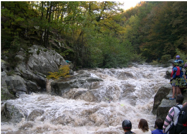
Escalier de la Peyre