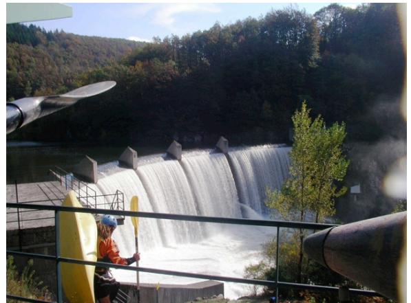
Barrage de Pontviel (départ)