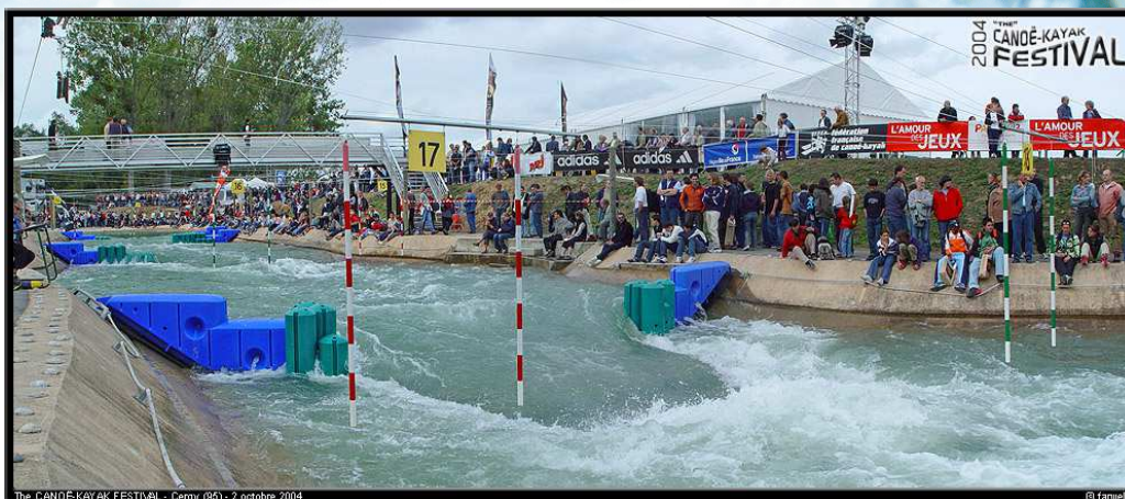
The CANOE-KAYAK FESTIVAL - Cergy (95) - 2 octobre 2004